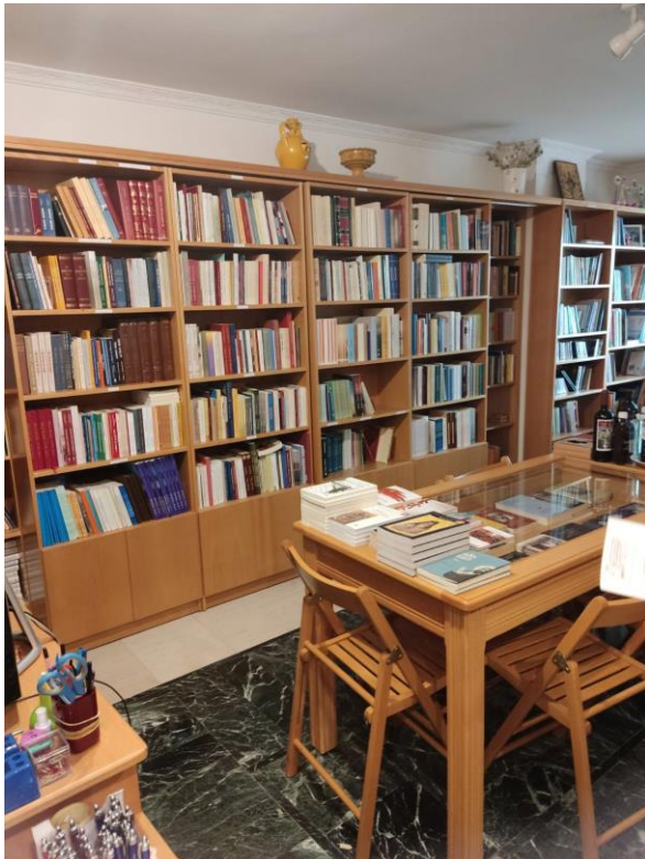
ΒΙΒΛΙΟΘΗΚΗ ΑΓΙΟΥ ΓΕΡΑΣΙΜΟΥ