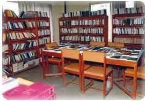
ΔΗΜΟΤΙΚΗ ΒΙΒΛΙΟΘΗΚΗ ΖΩΓΡΑΦΟΥ