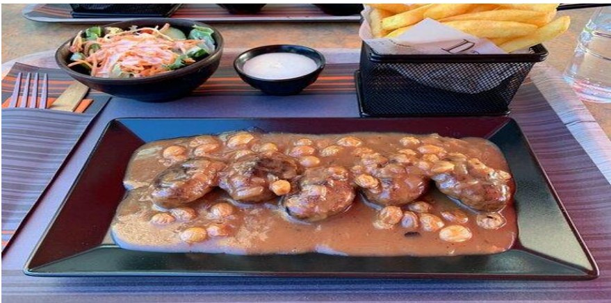
ΚΑΠΝΙΣΤΟ ΧΟΙΡΙΝΟ ΣΕΡΒΙΡΙΣΜΕΝΟ ΣΕ ΠΑΧΥΡΕΥΣΤΗ ΚΡΕΜΑ ΜΕ ΠΑΤΑΤΕΣ ΚΑΙ ΦΑΣΟΛΑΚΙΑ